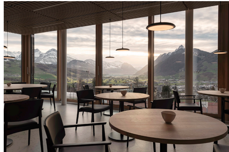
Die sieben Wohnhäuser der Überbauung folgen 'tänzelnd' dem leichten Hangverlauf am Dorfeingang zu Rickenbach (unten links). Auf den gebäudeumlaufenden Terrassen (oben rechts), durch die raumhohen Fenster der Wohnungen (oben links) sowie im neuen Restaurant Magdalena (unten rechts) geniesst man eine wunderschöne Aussicht über den Talkessel Schwyz.