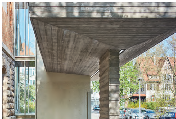
Bild 4. Vordach aus Sichtbeton

Das Treppenhaus erfährt durch eine elegante Holz-Glas-Wandabtrennung zu den Bürobereichen eine baurechtliche Aufwertung zu einem notwendigen Treppenhaus. Schließlich wurden die Büroräume mit einer komplett neuen Inneneinrichtung ausgestattet. Diese reagiert