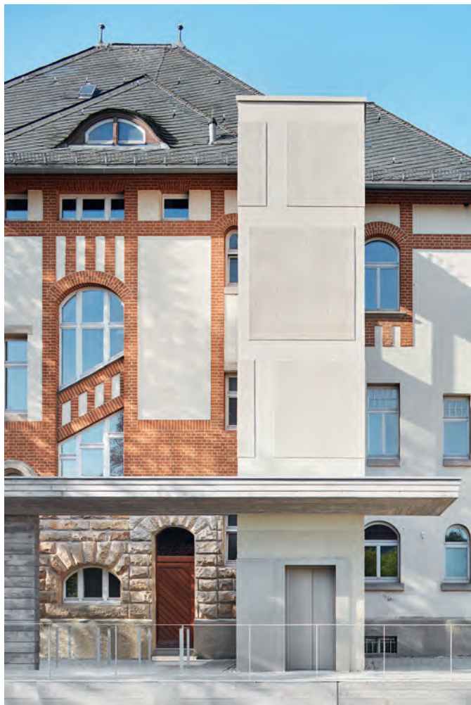
Bild 2. Aufzugsturm

interpretieren die historischen Bauteiloberflächen auf zeitgenössische Art und orientieren sich in Farbgebung und Körnung an den Originalelementen der dahinterliegenden Hausfassade.