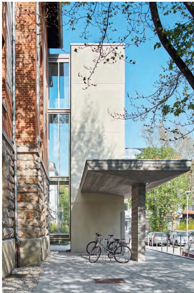
Bild 3. Aufzugsturm mit Vordach

Die historischen Jugendstilelemente des beeindruckenden Dielentreppenhauses konnten bis auf kleinere Restaurierungen nahezu im Original belassen werden. Auf Grundlage der Ergebnisse eines restauratorischen Gutachtens, in welchem Farbproben entnommen und Farbschichten untersucht wurden, konnte im Rahmen der Sanierung und