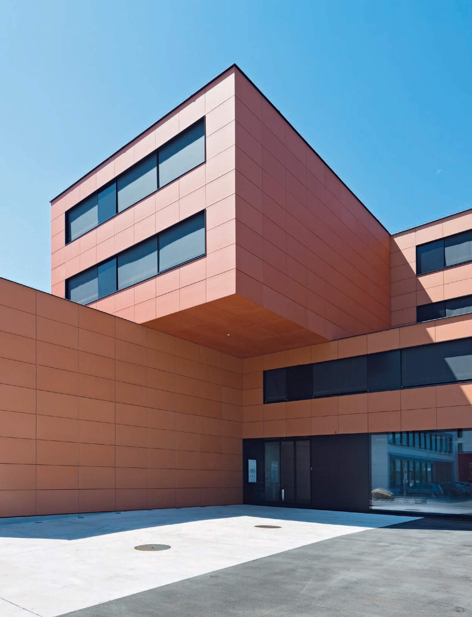
Gesamtansicht Anordnung der einzelnen Kuben