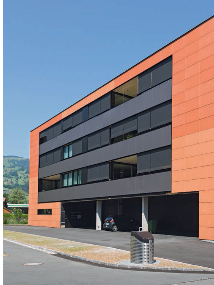
Seitenansicht mit Wohnungen

Dank der Südlage und der zeitgemässen Grundrisse entstanden helle, grosszügige Wohnungen mit gehobenem Ausbaustandard. Im ersten sowie zweiten Obergeschoss befinden sich je eine 3,5-Zimmer-Wohnung sowie eine Wohnung mit 4,5 Zimmern. Um den Blick auf die Berge freizugeben, wurden bei