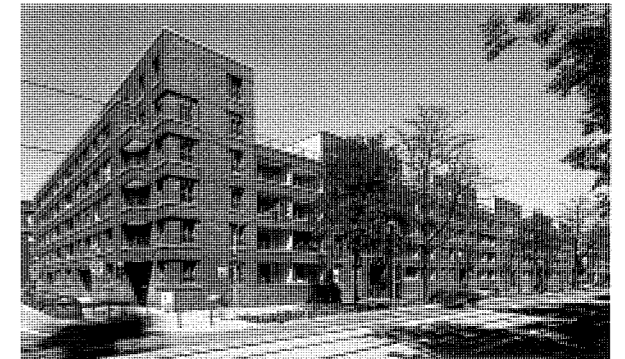
[1] Eckansicht des Wohnblocks

Man baut Stadt weiter, indem man den massiven Rand weiter nach außen verschiebt, die klassische Art wie Stadt organisch wächst. Das ewige zitierte Beispiel für dieses Wachsen ist das Wien der Dreißigerjahre. Wir nehmen das Thema des städtischen Blocks auf und manifestieren dadurch das Wachsen der Stadt, in diesem Fall von Osten nach Westen. Stadtrand heißt dementsprechend nicht Auflösung des Randes mit