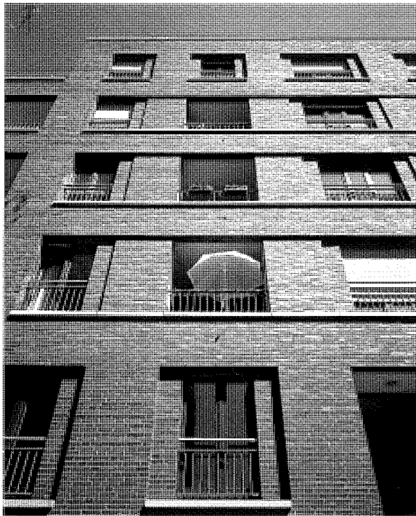
[2] Fassade des Wohnblocks